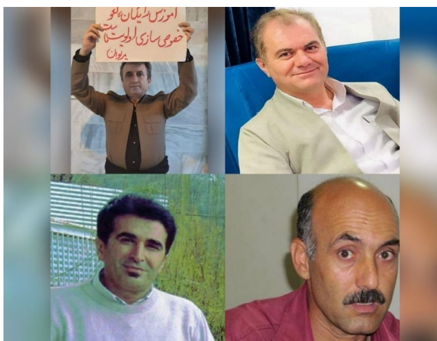
کانون صنفی معلمان اسلامشهر سناریوسازی "روزنامه کیهان" و "برنامه ۲:۳۰" علیه فعالان صنفی را محکوم کرد

حزب کمونیست کارگری ایران - حکمتیست ۲۸ اردیبهشت ۱۴۰۱ - ۱۸ مه ۲۰۲۲