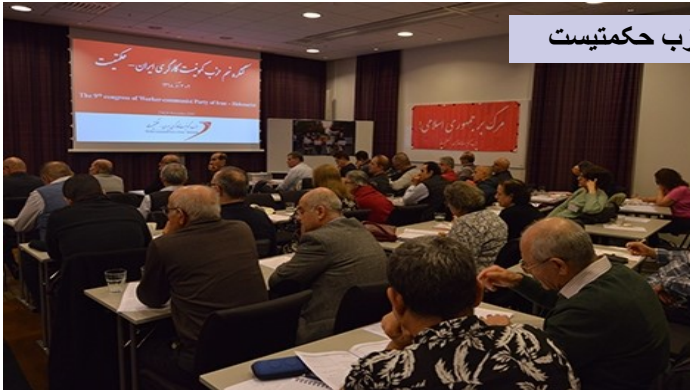
کنگره نهم حزب حکمتیست

IBAN: NO57 0532 1432 400 BIC: DNBANOKKXXX