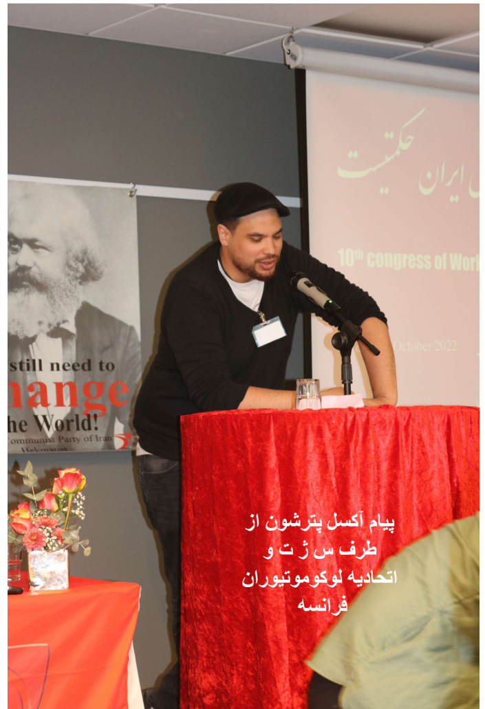
پیام آکسل پترشون از طرف س‌ژت و اتحادیه لوکوموتیوران فرانسه

ترجمه و متن فارسی پیام بزودی منتشر میشود