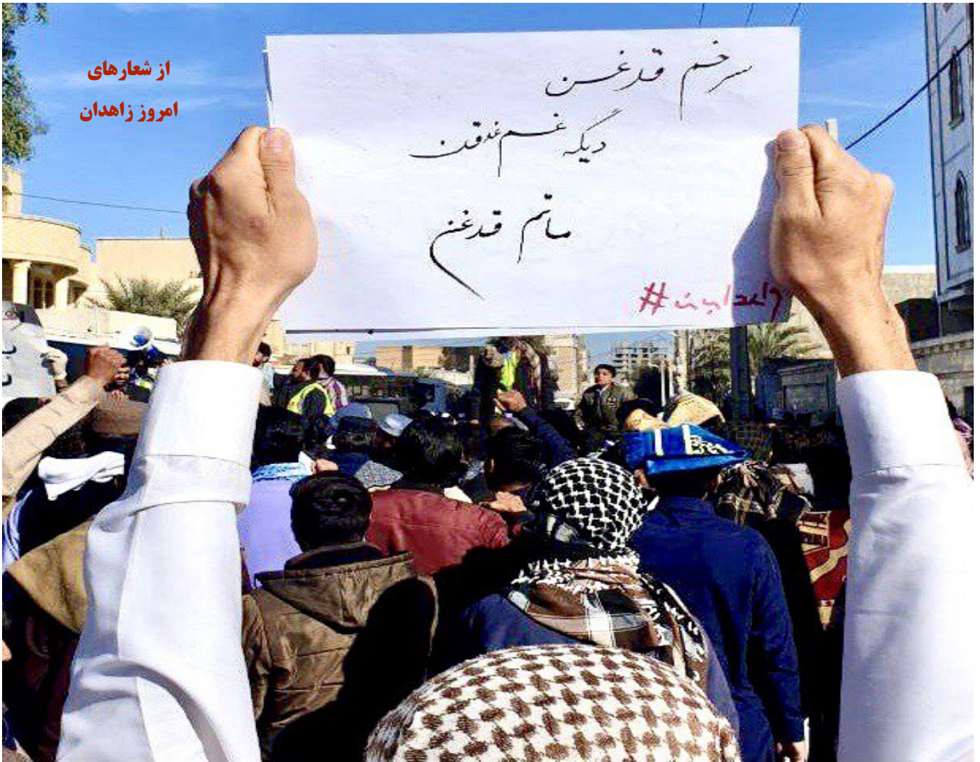
از شعارهای امروز زاهدان