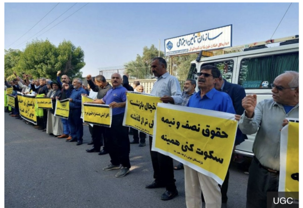
افزایش سن بازنشستگی

۱- اقدام به تجمیع و ادغام تمام صندوق‌های بازنشستگی از تامین اجتماعی (صندوق کارگران بخش خصوصی) و صندوق بازنشستگان کشوری (صندوق کارگران و کارمندان دولت) و صندوق‌های خاص دیگر کارگران (صندوق بیمه اجتماعی روستاییان و کشاورزان، صندوق کارگران فولاد، صندوق کارگران نفت و...) و حتی صندوق نیروهای مسلح در یک صندوق واحد زیر نظر دولت جمع می‌شوند. به این ترتیب صندوق تامین اجتماعی که بزرگترین صندوق بازنشستگی کشور محسوب شده و از اموال تشکیل شده از کار کارگران بخش خصوصی است، همه با اموال مایملک آن به دولت واگذار می‌شود. دولت مالک این صندوق نیست و همه شرکت‌ها و خود این صندوق متعلق به کارگران است و صندوق درحالی دولتی می‌شود که خود دولت به صندوق بدهکار است. بدهی دولت به این صندوق‌ها که حاصل تحمیل سخت‌ترین تعهدها به این صندوق‌ها و استقراض غیرقانونی از طریق عدم تسویه تعهدات دولت است، بیش از ۲۰ میلیارد دلار تخمین زده می‌شود و هنوز تسویه نشده است.