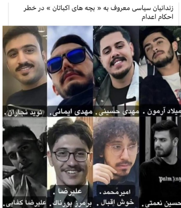
زندانیان سیاسی معروف به «بچه های اکیاتان» در خطر احکام اعدام