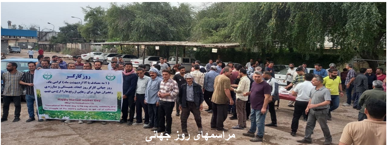
مراسمهای روز جهانی

در پاریس کارگران بخش جمع آوری زباله، مراکز صنعتی، حمل و نقل، و دیگر مراکز کارگری در آستانه المپیک تابستانی در فرانسه هشدار داده اند که برای اعتصاب دیگری خود را آماده میکنند. اگر چه اخیراً موفق شدند قرارداد بهتری برای بالا بردن دستمزدهایش بدست