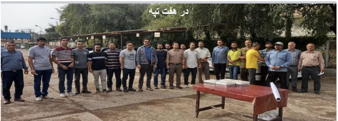
در هفت تپه