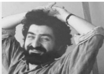
اسلام و اسلام زدایی منصور حکمت ژانویه ۱۹۹۹

فرد در اسلام، چه راستین و چه غیر آن، بی حقوق و بی حرمت است. زن در اسلام برده است. کودک در اسلام در ردیف احشام است. عقیده آزاد در اسلام معصیت و مستوجب عقوبت است. موسیقی فساد است. سکس، بدون جواز و بدون داغ مذهب بر کپل مرتکبیش، گناه کبیره است. این دین مرگ و خون و عبودیت است